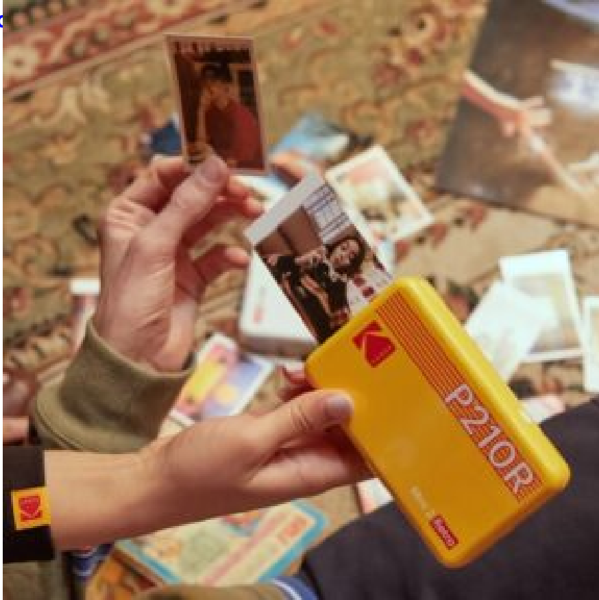
kodak mini shot2 RETRO+